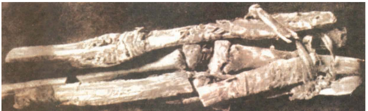
Imagen: Vendaje de una fractura del fémur. Egipto, Imperio Antiguo (2200 a de C.)